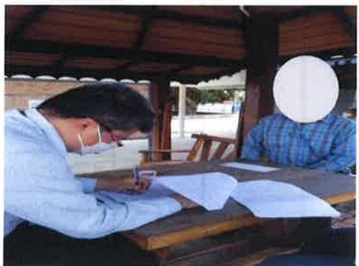
รูปที่ ค.3-1 ภาพถ่ายประกอบการศึกษาและสำรวจสภาพเศรษฐกิจ-สังคม และความคิดเห็น ต่อโครงการโรงไฟฟ้าพลังความร้อนร่วม บริษัท บางกอกโคเจนเนอเรชั่น จำกัด