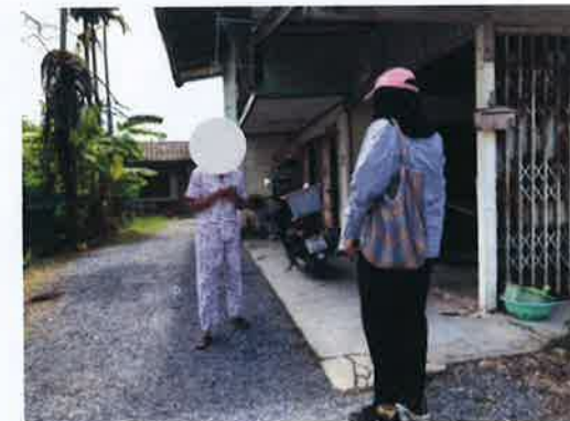
รูปที่ ก.3-1 ภาพถ่ายประกอบการศึกษาและสำรวจสภาพเศรษฐกิจ-สังคม และความคิดเห็น ต่อโครงการโรงไฟฟ้าพลังความร้อนร่วม บริษัท บางกอกโกลเด้นเนเธอร์แลนด์ จำกัด